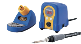
디지털 온도조절 납땜인두기