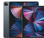
아이패드 프로 5세대 12.9 128G Wi-Fi