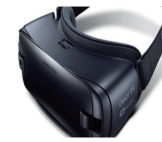
New 기어 VR